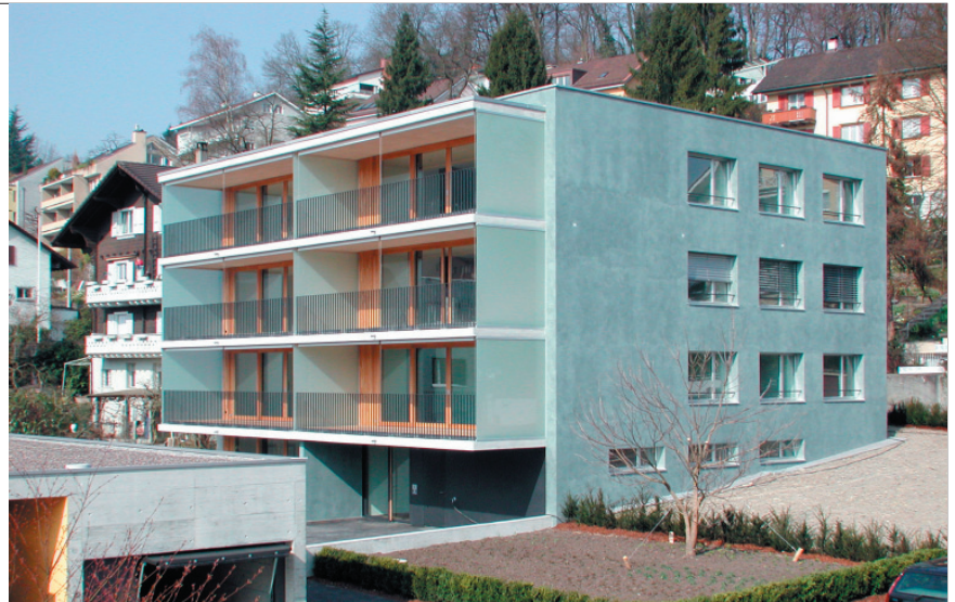
Mehrfamilienhaus in Luzern: grosse, sonnendurchflutete Küchenwohnzimmer mit einem Kastenbalkon.

nur ein, was sie brauchen. Bleibt die Frage: Wärs nicht noch günstiger, wenn im überraschend grosszügigen Garten ein weiteres Haus Stünde? Wäre schon, kann aber nicht, weil die Ausnützungsziffer das nicht zulässt. Und das ist gut, denn so haben die Bewohnerinnen und Bewohner Luft, Licht, Sonne und einen Blick bis in die Alpen.